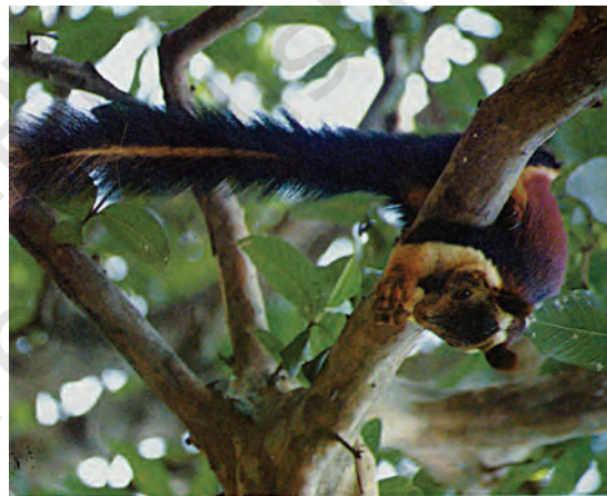
चित्र 5.3(b) : विशाल गिलहरी।