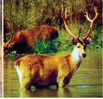
चित्र 5.6 : बारहसिंघा।