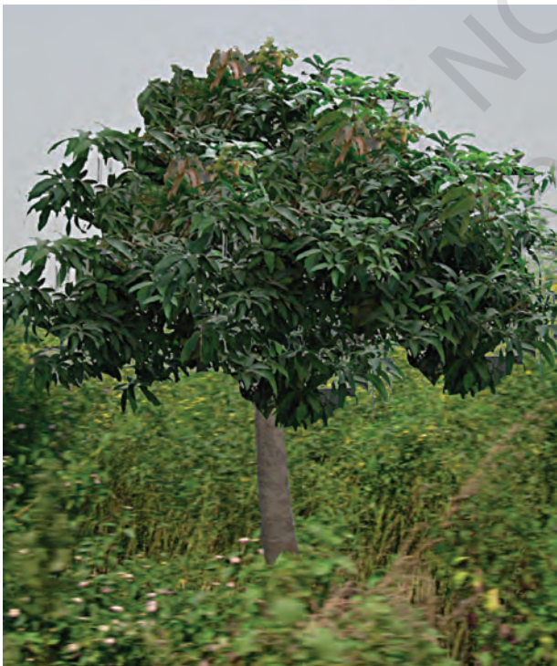
चित्र 5.3(a) : जंगली आम।

माधवजी ने पचमढी जैवमण्डल आरक्षित क्षेत्र में स्थित साल और जंगली आम [चित्र 5.3(a)] के पेड़ को