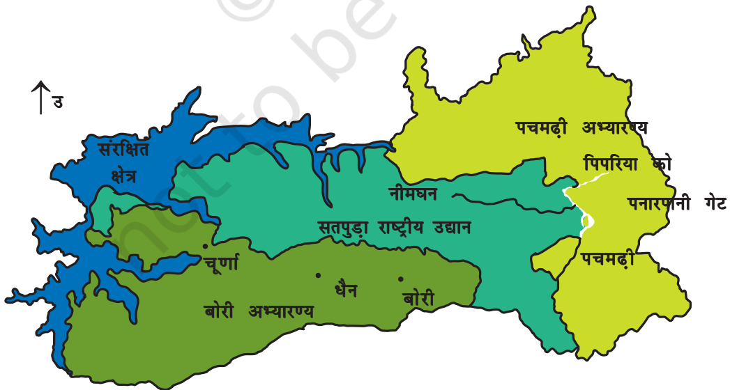
चित्र 5.1 : पचमढी जैवमण्डल आरक्षित क्षेत्र।